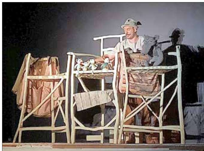
Deutsch-Sorbisches Volkstheater Bautzen Der Wolf und die 7 Geißlein - Puppentheater nach dem Märchen der Gebrüder Grimm