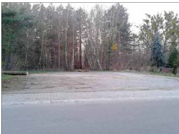
Ansicht von der Weststraße aus